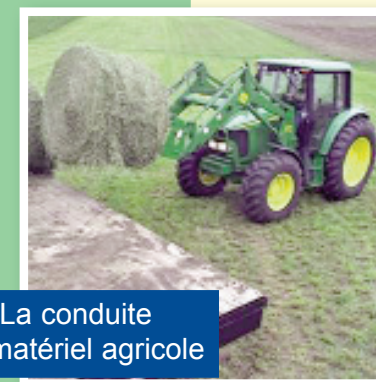
La conduite de matériel agricole