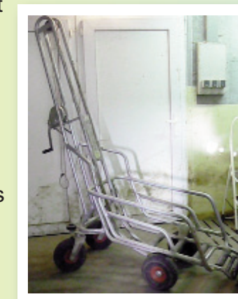
Sortez vos carcasses avec un engin de levage adapté

Il existe des systèmes manuels ou motorisés.