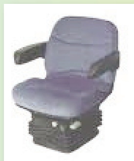
Moins de vibrations et de secousses