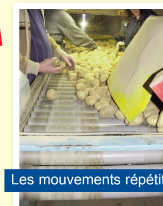
Les mouvements répétitifs

" Quand on est pressé, les journées sont parfois bien courtes, on fait au plus vite ! "