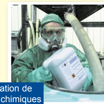
L'utilisation de produits chimiques dangereux