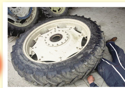
La manutention de charges lourdes