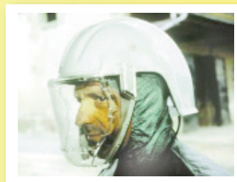
Plus de confort et moins de contact avec le produit