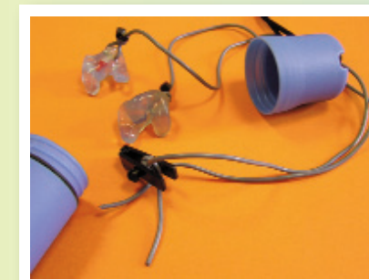
Atténuent les hautes fréquences mais laisse passer la parole

Attention la réalisation de l'empreinte du conduit auditif doit être réalisée chez un audioprothésiste.