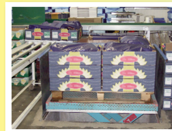
Limitez les mauvaises postures