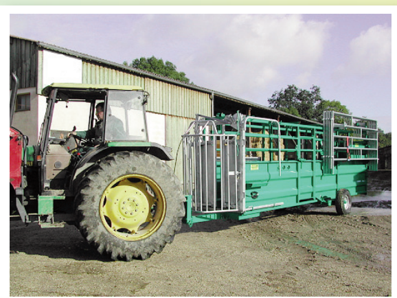
Animal maintenu et maîtrisé = opérateur en sécurité

Le couloir de contention doit être doté en plus d'une entrée latérale arrière et de dispositif anti-recul pour le couloir fixe.