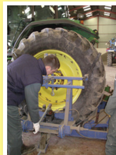
Une aide mécanique pour préserver le dos