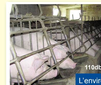
110db L'environnement de travail bruyant

Précipitation et mauvaise organisation du travail peuvent être à l'origine d'accidents graves et / ou avoir des répercussions sur la santé.