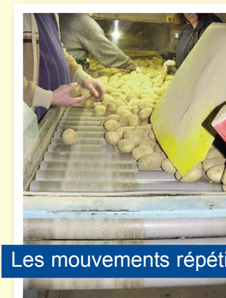
Les mouvements répétitifs

" Quand on est pressé, les journées sont parfois bien courtes, on fait au plus vite ! "