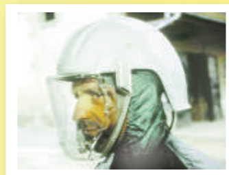
Plus de confort et moins de contact avec le produit