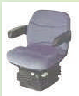
Moins de vibrations et de secousses