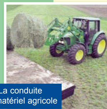
La conduite de matériel agricole