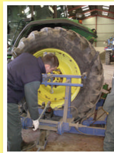
Une aide mécanique pour préserver le dos