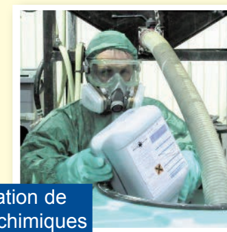
L'utilisation de produits chimiques dangereux