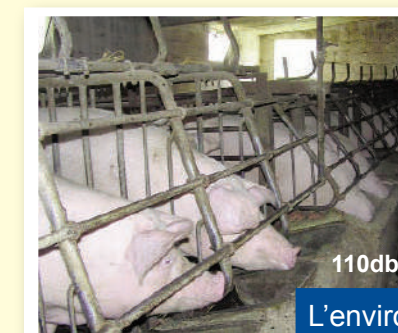
110db L'environnement de travail bruyant

Précipitation et mauvaise organisation du travail peuvent être à l'origine d'accidents graves et / ou avoir des répercussions sur la santé.